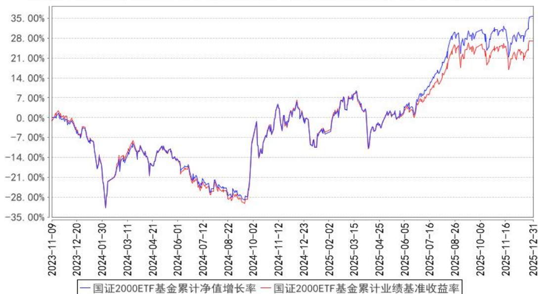
国证2000ETF基金累计净值增长率与同期业绩比较基准收益率的历史走势对比图