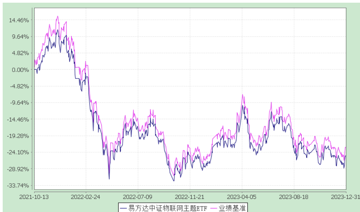
易方达中证物联网主题交易型开放式指数证券投资基金 份额累计净值增长率与业绩比较基准收益率历史走势对比图 (2021年10月13日至2023年12月31日)

注：自基金合同生效至报告期末，基金份额净值增长率为-25.14%，同期业绩比较基准收益率为-22.68%。