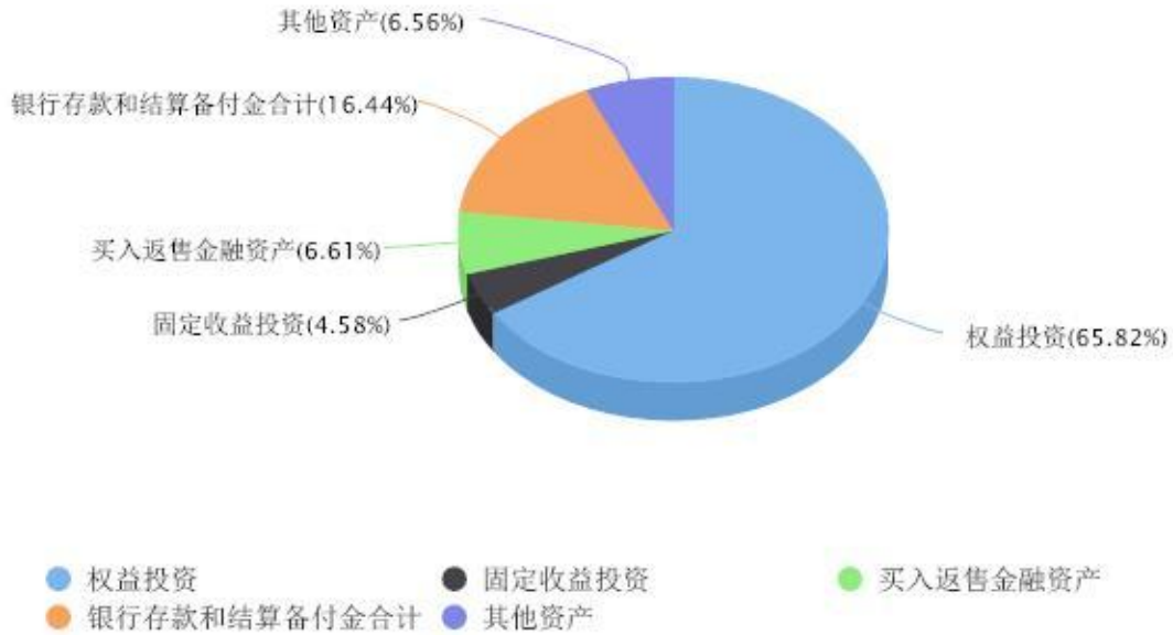
投资组合资产配置图表 数据截止日期:2024年12月31日