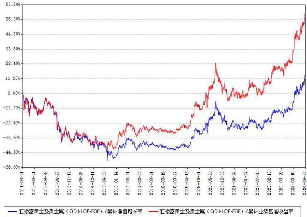
汇添富黄金及贵金属（QDII-LOF-FOF）A累计净值增长率与同期业绩比较基准收益率对比图