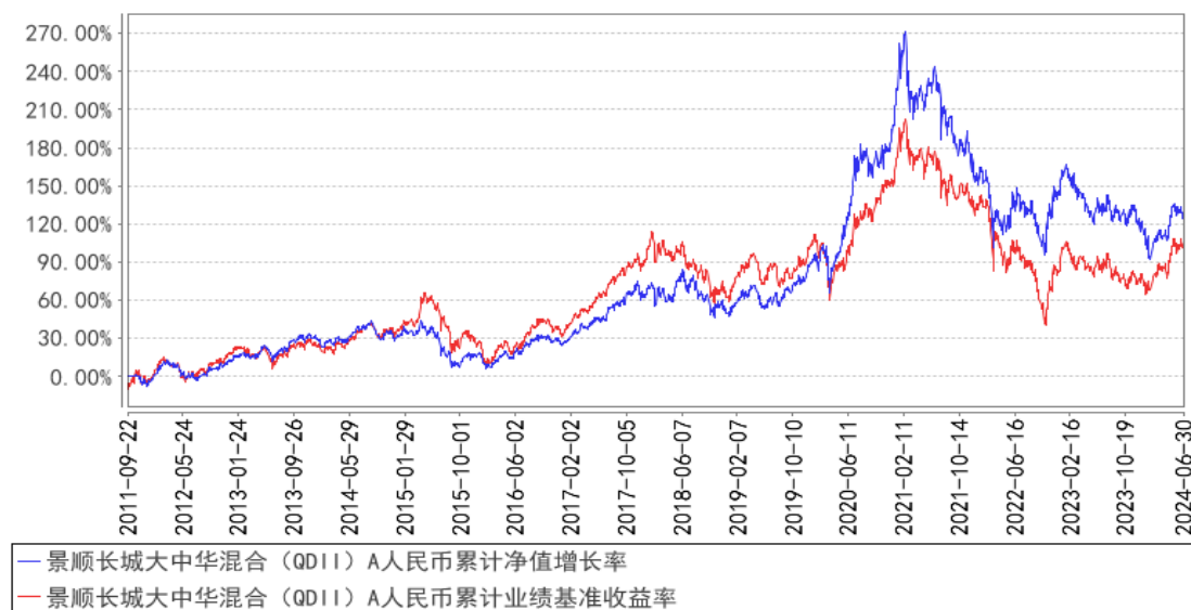
景顺长城大中华混合（QDII）A人民币累计净值增长率与同期业绩比较基准收益率的历史走势对比图