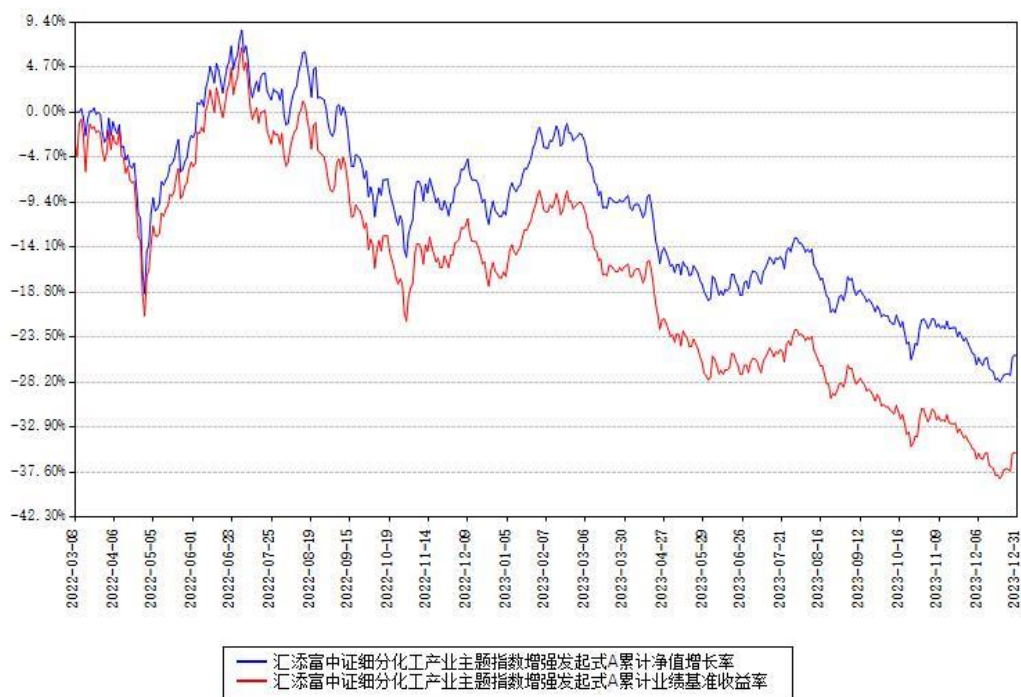
汇添富中证细分化工产业主题指数增强发起式A累计净值增长率与同期业绩基准收益率对比图