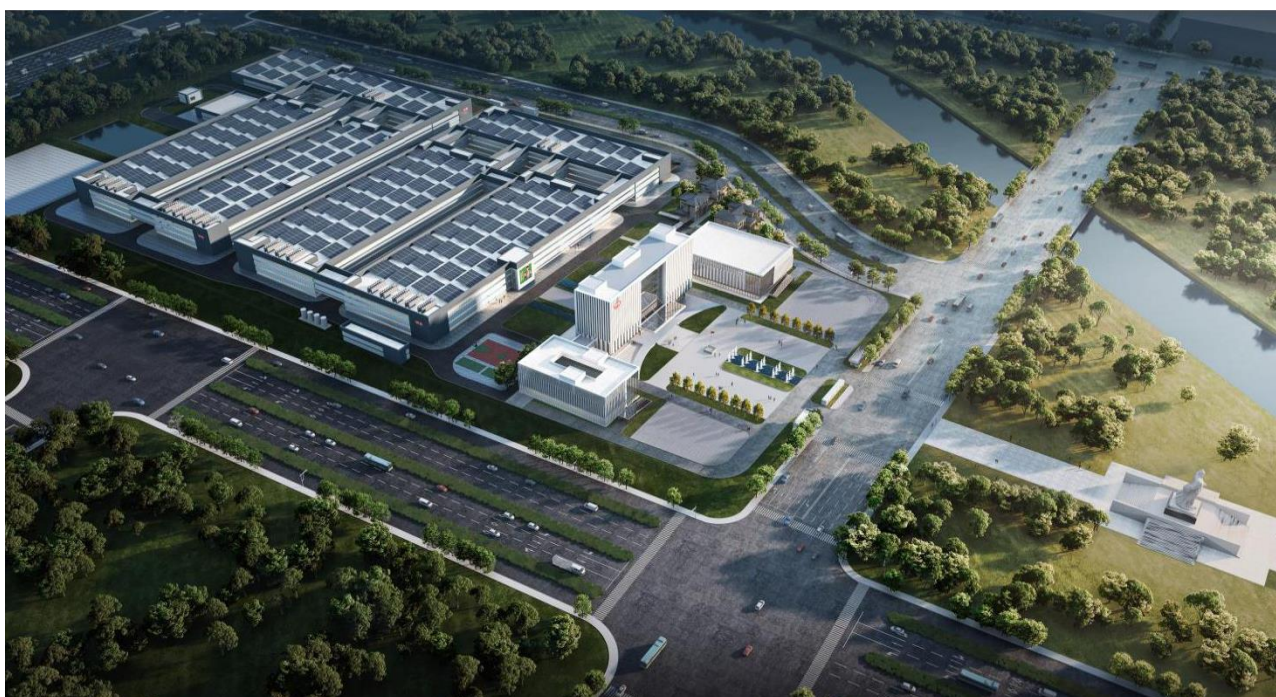
南阳仲景食品产业园项目（一期）

报告期内，公司年产 1200 吨调味配料项目顺利建成投产，进一步扩大配料业务产能，提升规模效应，增强市场竞争力；投资设立仲景食品（南阳）有限公司，负责实施仲景食品产业园项目，项目总占地约 530 亩，总投资约 15 亿元，其中一期项目已完成规划设计，一期建成后预计可实现年产 6000 万瓶调味酱；投资设立上海仲景实业发展有限公司，拟组建上海研创中心，吸引人才，加快研发创新和市场拓展能力；公司将形成生产基地西峡-南阳，营销研创郑州-上海的跨越式发展布局，为未来持续稳定发展奠定坚实的基础。