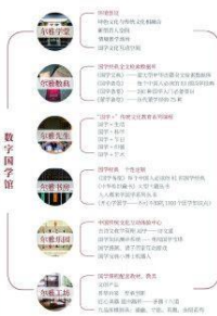
运用三大核心技术主持编纂的大型古籍整理项目