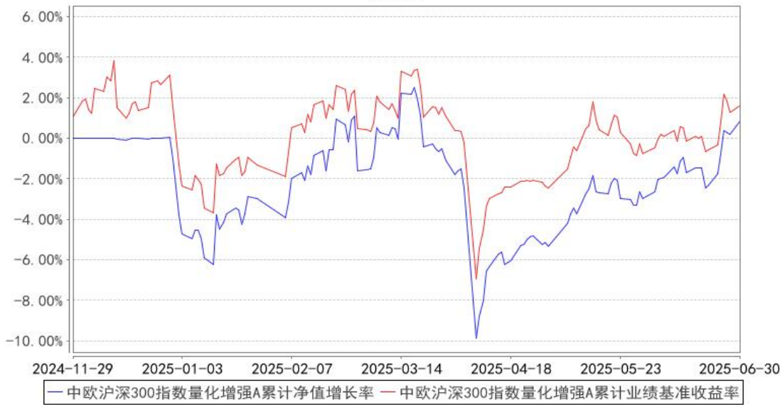
中欧沪深300指数量化增强A累计净值增长率与同期业绩比较基准收益率的历史走势对比图

注：本基金基金合同生效日期为 2024 年 11 月 29 日，自基金合同生效日起到本报告期末不满一年，按基金合同的规定，本基金自基金合同生效起六个月为建仓期，建仓期结束时各项资产配置比例