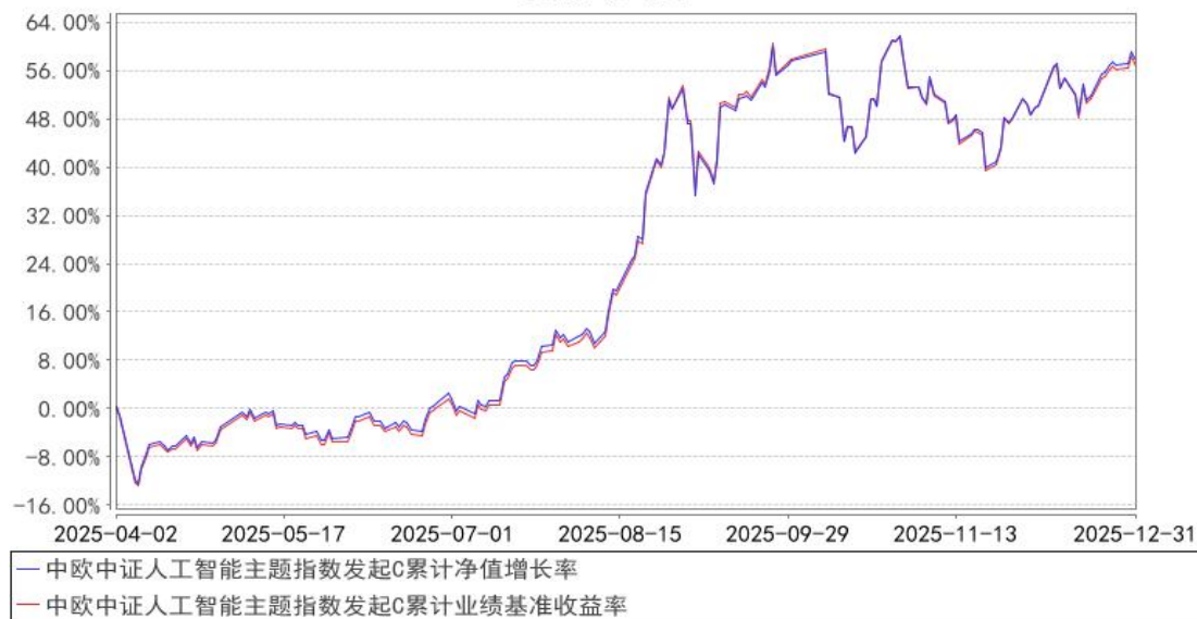
中欧中证人工智能主题指数发起C累计净值增长率与同期业绩比较基准收益率的历史走势对比图

注：本基金基金合同生效日期为 2025 年 4 月 2 日，自基金合同生效日起到本报告期末不满一年，按基金合同的规定，本基金自基金合同生效起六个月为建仓期，建仓期结束时各项资产配置比例