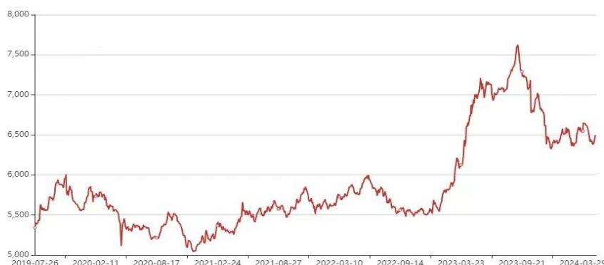
图 2. 广西白糖现货成交指数

价为 5658 元/吨，2023 年 12 月 29 日白砂糖成交价为 6438 元/吨，较年初同比增长 13.79%，全年最高成交价为 7625 元/吨，最低成交价为 5544 元/吨。