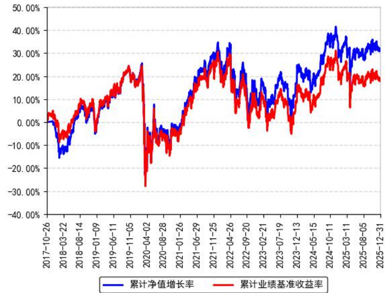
南方道琼斯美国精选REIT指数（QDII-LOF）A累计净值增长率与同期业绩比较基准收益率的历史走势对比图