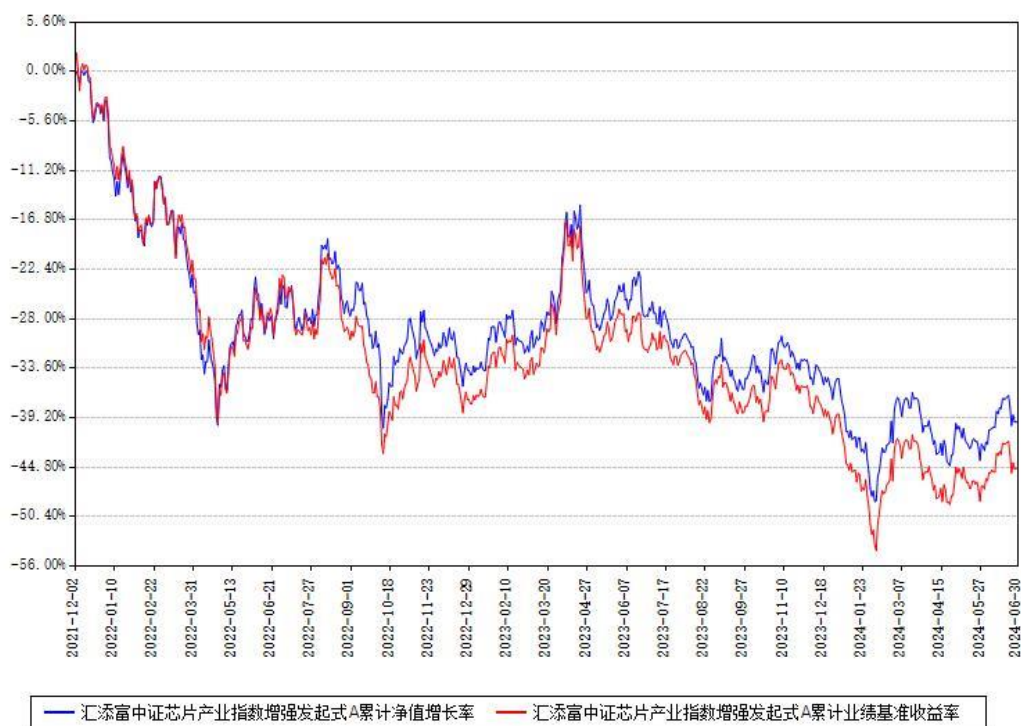
汇添富中证芯片产业指数增强发起式A累计净值增长率与同期业绩基准收益率对比图