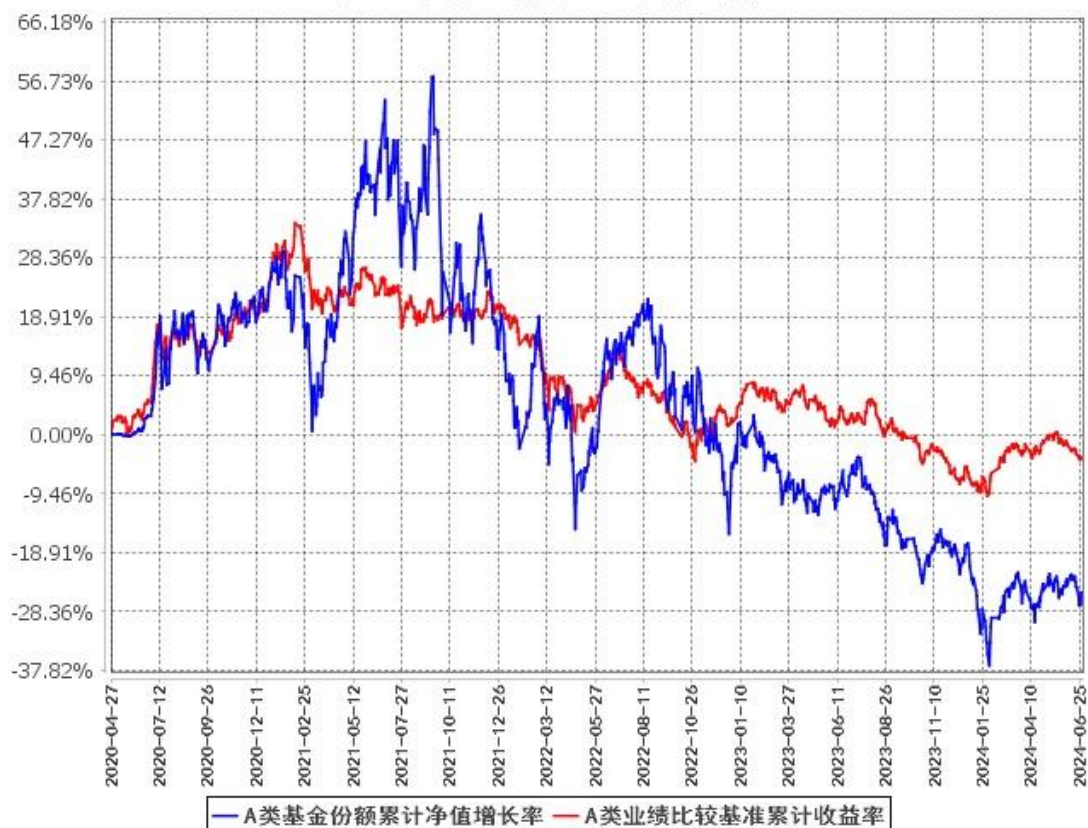
A类基金份额累计净值增长率与同期业绩比较基准收益率的历史走势对比图 (2020年4月27日至2024年6月30日)