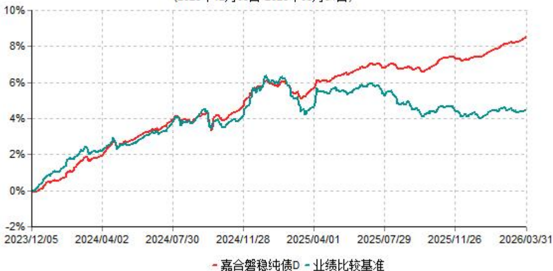
嘉合磐稳纯债D累计净值增长率与业绩比较基准收益率历史走势对比图 (2023年12月05日-2026年03月31日)

注：本基金于2023年12月05日增设D类基金份额，D类基金份额实际存续从2023年12月05日开始。