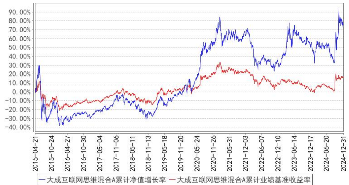
大成互联网思维混合A累计净值增长率与同期业绩比较基准收益率的历史走势对比图

（二） 自基金合同生效以来基金份额累计净值增长率变动及其与同期业绩比较基准收益率变动的比较