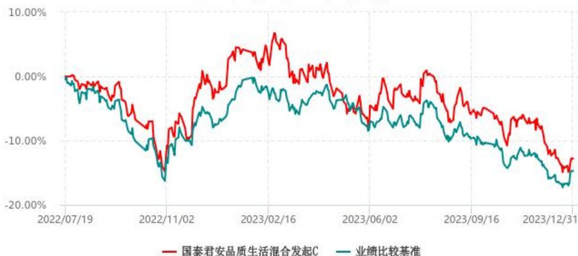
国泰君安品质生活混合发起C累计净值增长率与业绩比较基准收益率历史走势对比图 (2022年07月19日-2023年12月31日)

注：按基金合同和招募说明书的约定，本基金的建仓期为六个月，建仓期结束时各项资产配置比例符合基金合同的有关约定。