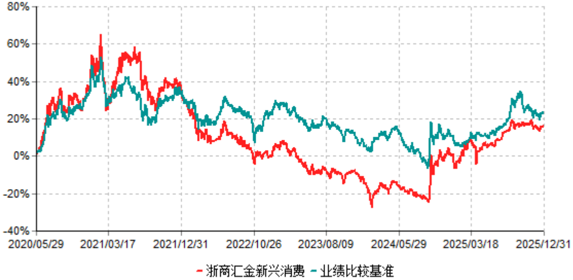
浙商汇金新兴消费累计净值增长率与业绩比较基准收益率历史走势对比图 (2020年05月29日-2025年12月31日)

注：本报告期内本基金的业绩比较基准2025年1月1日至2025年5月22日为：中证主要消费行业指数收益率×70%+中债总财富指数(总值)收益率×30%；于2025年5月23日变更为：中证新生代消费主题指数收益率×70%+中债总财富指数(总值)收益率×30%。