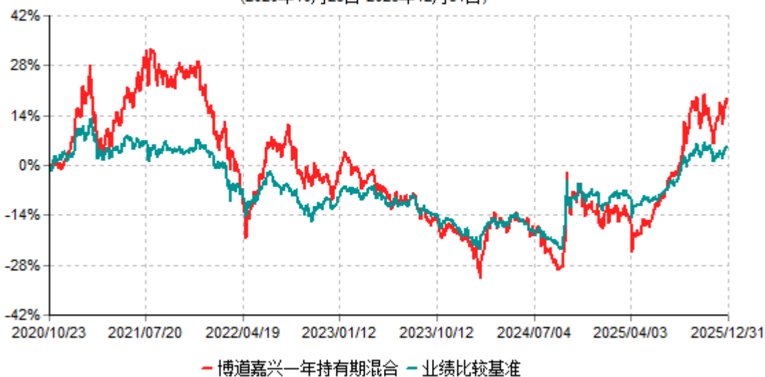
博道嘉兴一年持有期混合累计净值增长率与业绩比较基准收益率历史走势对比图 (2020年10月23日-2025年12月31日)