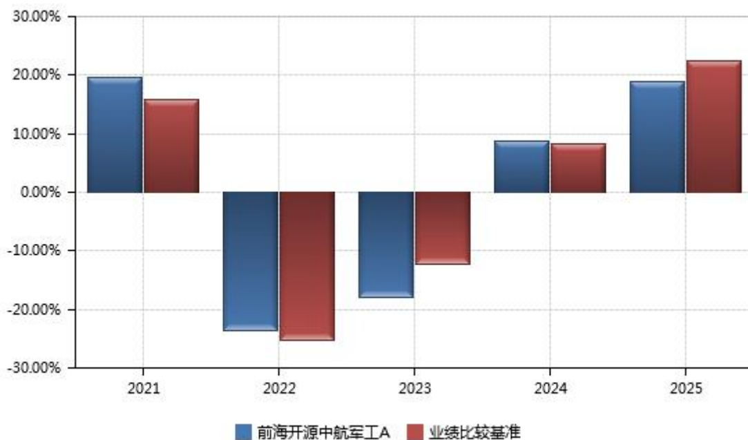
前海开源中航军工 C