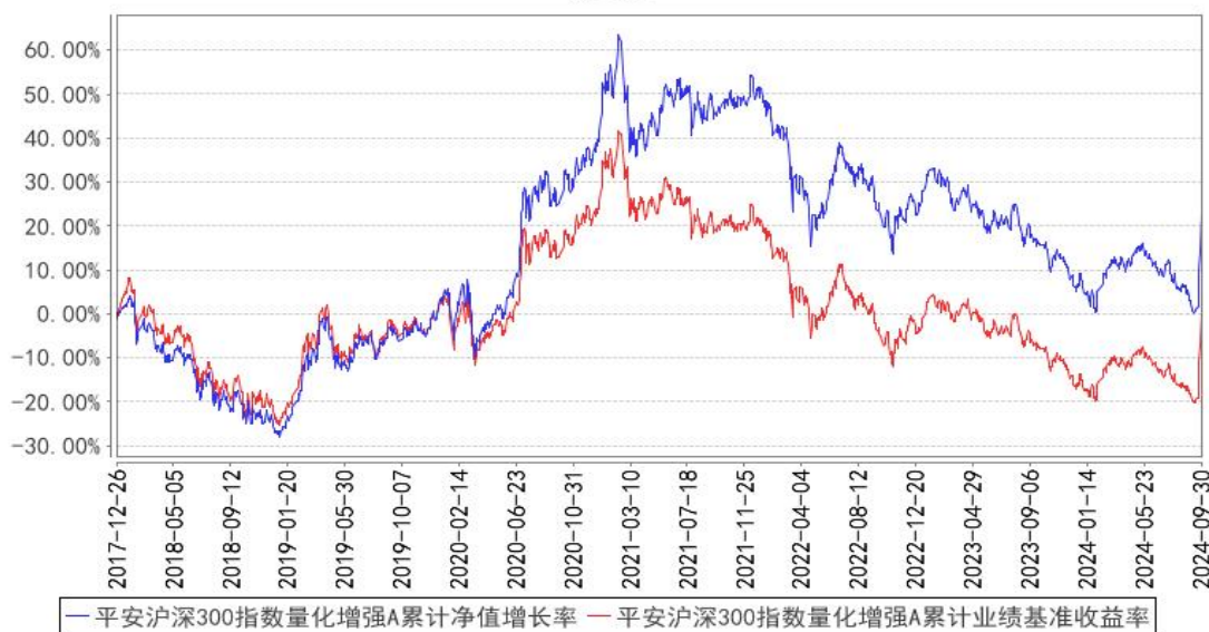
平安沪深300指数量化增强A累计净值增长率与同期业绩比较基准收益率的历史走势对比图