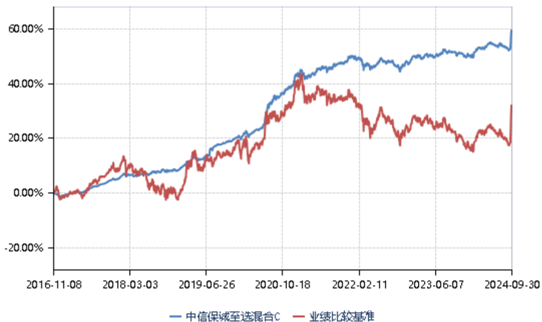
中信保诚至选混合 E