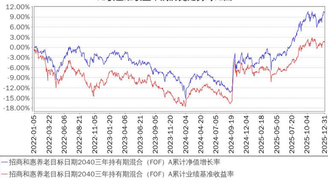
招商和惠养老目标日期2040三年持有期混合（FOF）A累计净值增长率与同期业绩比较基准收益率的历史走势对比图