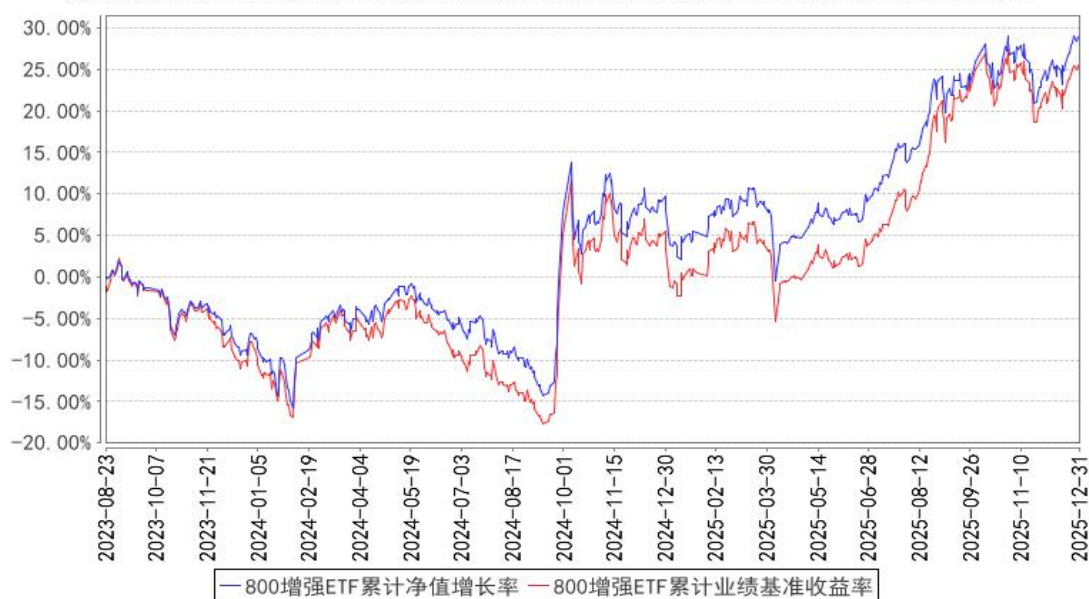
800增强ETF累计净值增长率与同期业绩比较基准收益率的历史走势对比图

注：按基金合同的规定，本基金自基金合同生效起六个月内为建仓期，建仓期结束时本基金的各