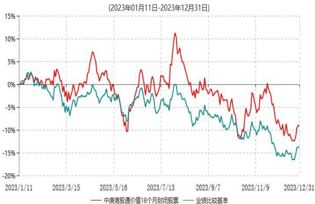
中庚港股通价值18个月封闭运作股票型证券投资基金累计净值增长率与业绩比较基准收益率历史走势对比图