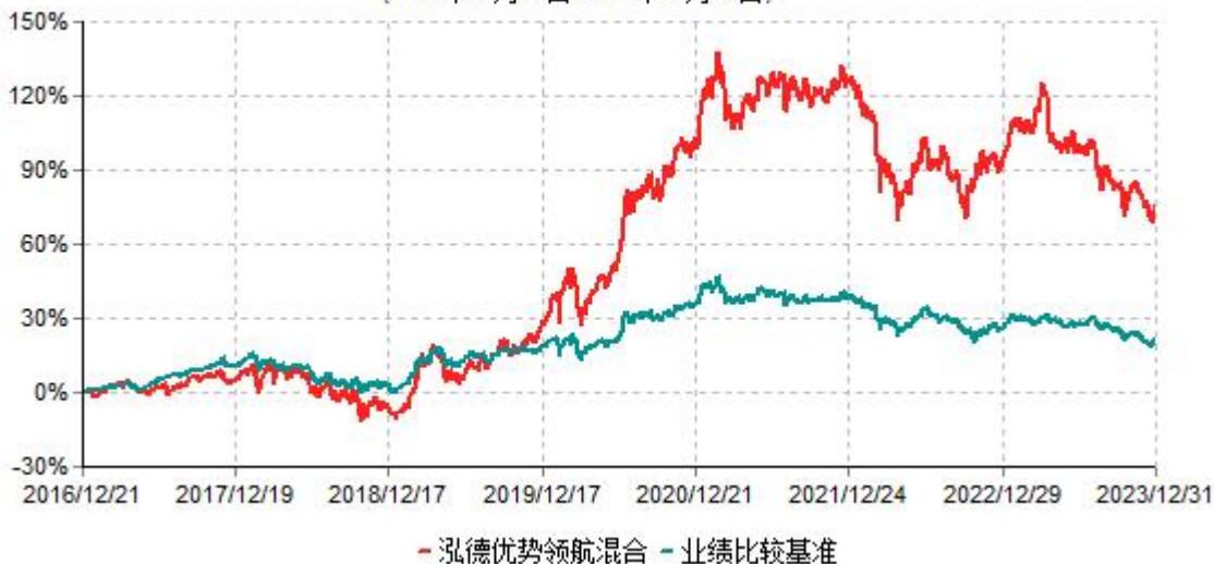
泓德优势领航灵活配置混合型证券投资基金累计净值增长率与业绩比较基准收益率历史走势对比图 (2016年12月21日-2023年12月31日)

注：根据基金合同的约定，本基金建仓期为6个月，截至报告期末，本基金的各项投资比例符合基金合同关于投资范围及投资限制规定。