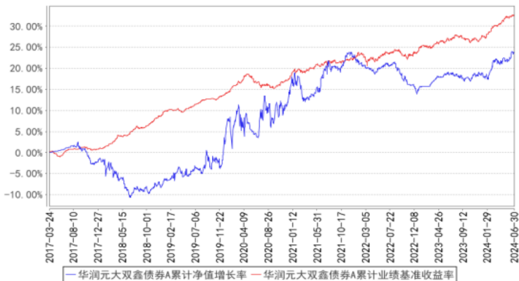
华润元大双鑫债券A累计净值增长率与同期业绩比较基准收益率的历史走势对比图