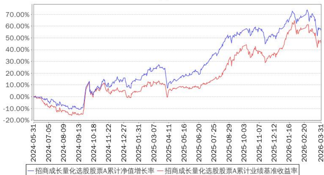
招商成长量化选股股票A累计净值增长率与同期业绩比较基准收益率的历史走势对比图