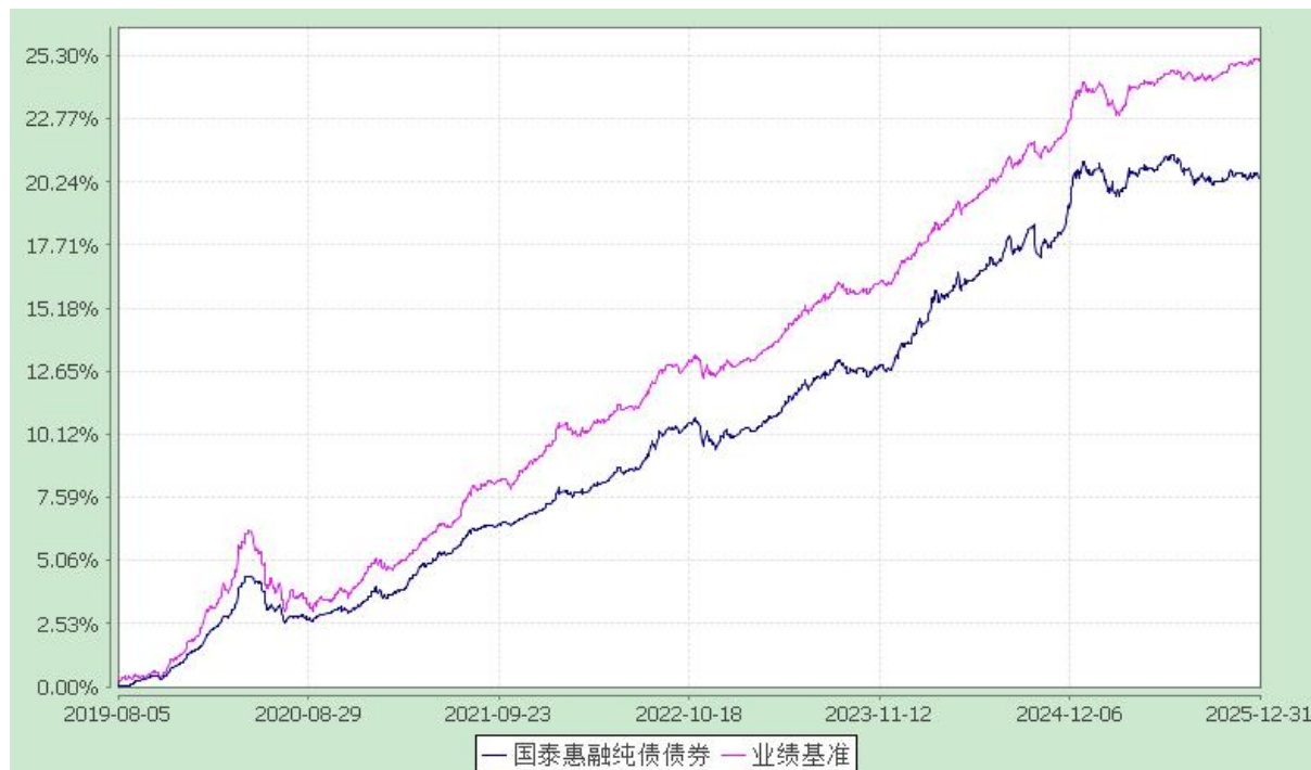
自基金合同生效以来份额累计净值增长率与业绩比较基准收益率的历史走势对比图 (2019 年 8 月 5 日至 2025 年 12 月 31 日)

注：本基金合同生效日为 2019 年 8 月 5 日，在六个月建仓期结束时，各项资产配置比例符合合同约定。