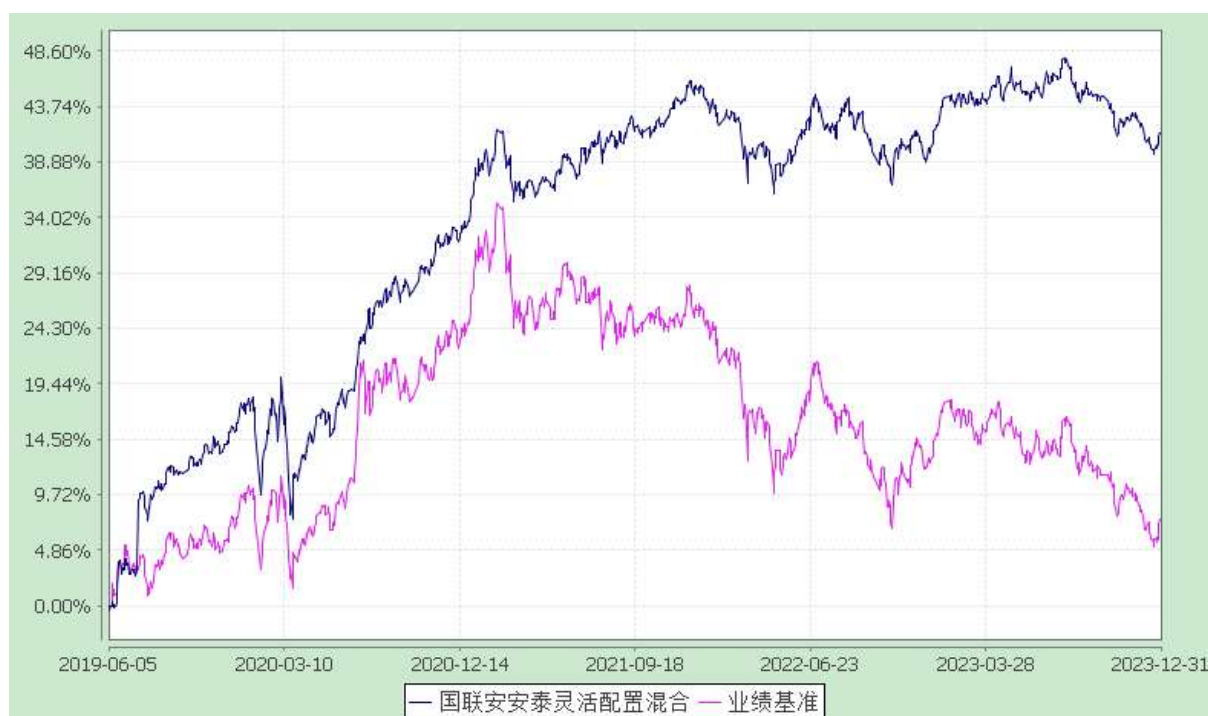
自基金转型以来份额累计净值增长率与业绩比较基准收益率的历史走势对比图 (2019 年 6 月 5 日至 2023 年 12 月 31 日)