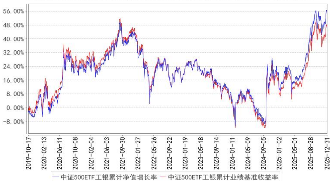
中证500ETF工银累计净值增长率与同期业绩比较基准收益率的历史走势对比图