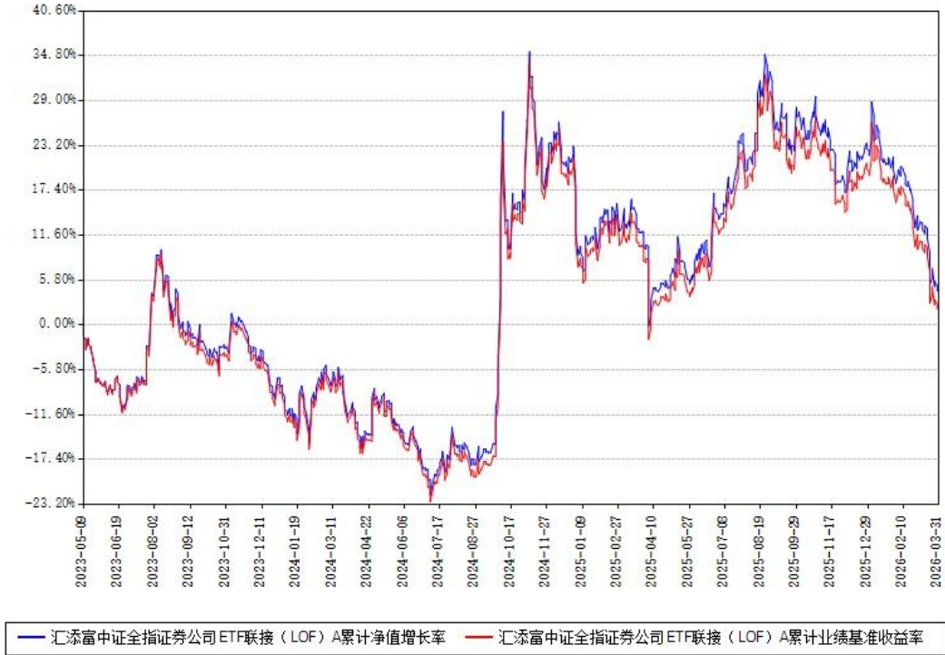
汇添富中证全指证券公司ETF联接（LOF）A累计净值增长率与同期业绩基准收益率对比图