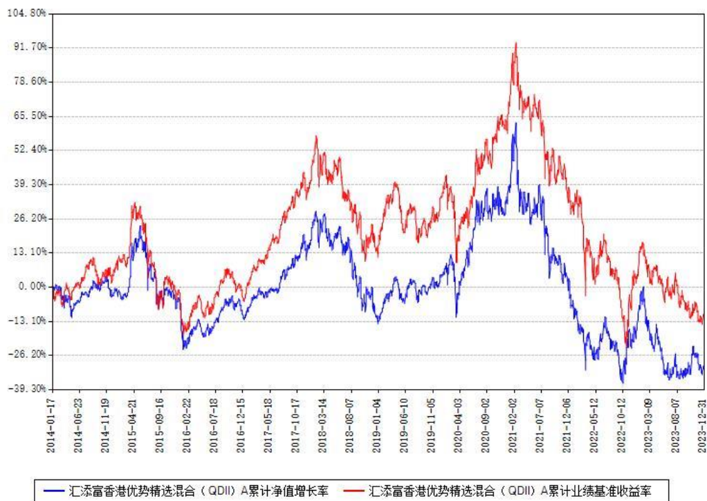
汇添富香港优势精选混合（QDII）C累计净值增长率与同期业绩基准收益率对比图