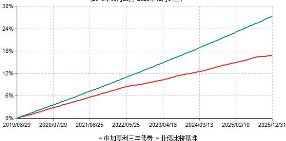
中加享利三年债券累计净值增长率与业绩比较基准收益率历史走势对比图 (2019年08月29日-2025年12月31日)