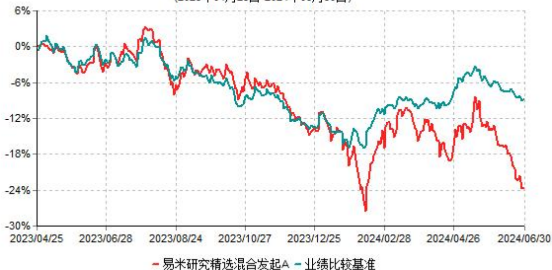
易米研究精选混合发起A累计净值增长率与业绩比较基准收益率历史走势对比图 (2023年04月25日-2024年06月30日)