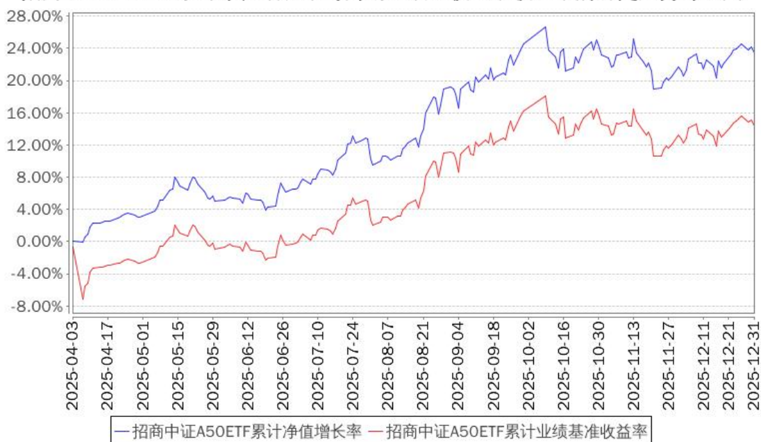
招商中证A50ETF累计净值增长率与同期业绩比较基准收益率的历史走势对比图

注：本基金合同于 2025 年 4 月 3 日生效，截至本报告期末基金成立未满一年；自基金成立日起 6 个月内为建仓期，建仓期结束时各项资产配置比例符合合同约定。