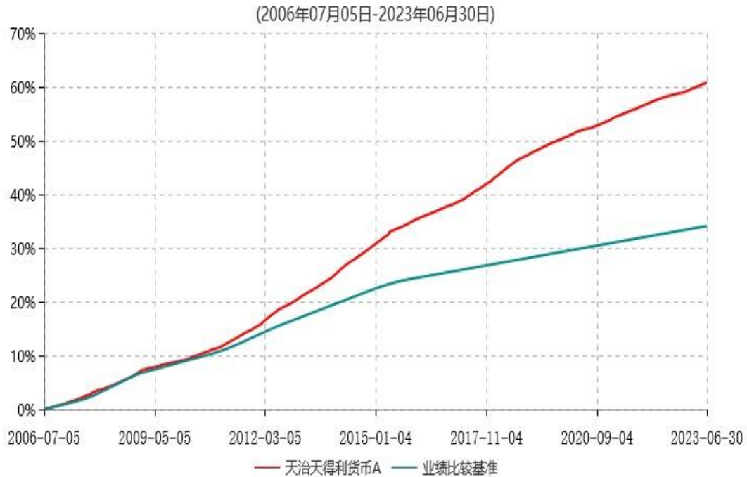
天治天得利货币A累计净值收益率与业绩比较基准收益率历史走势对比图