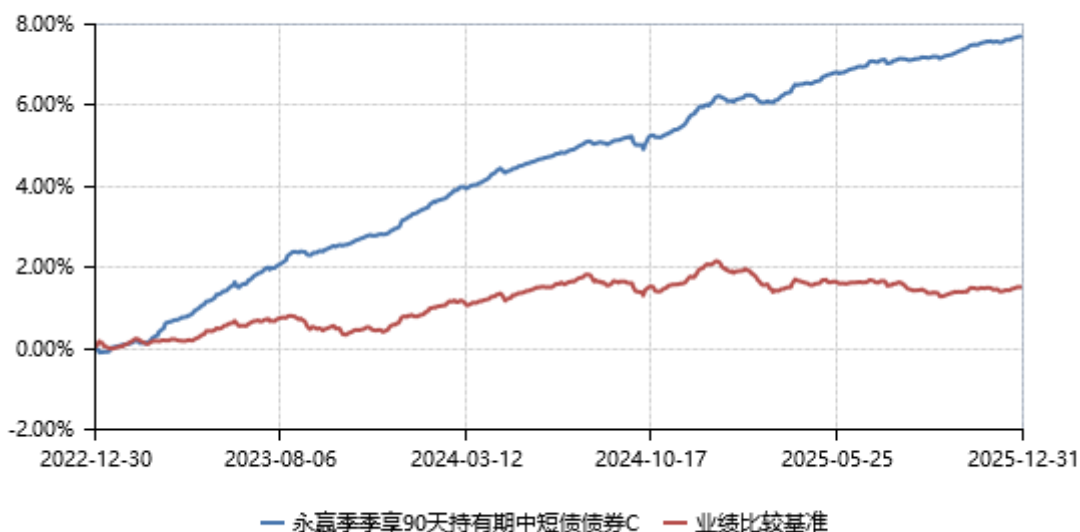
永赢季季享90天持有期中短债债券C累计净值收益率与业绩比较基准收益率历史走势对比图 (2022年12月30日-2025年12月31日)