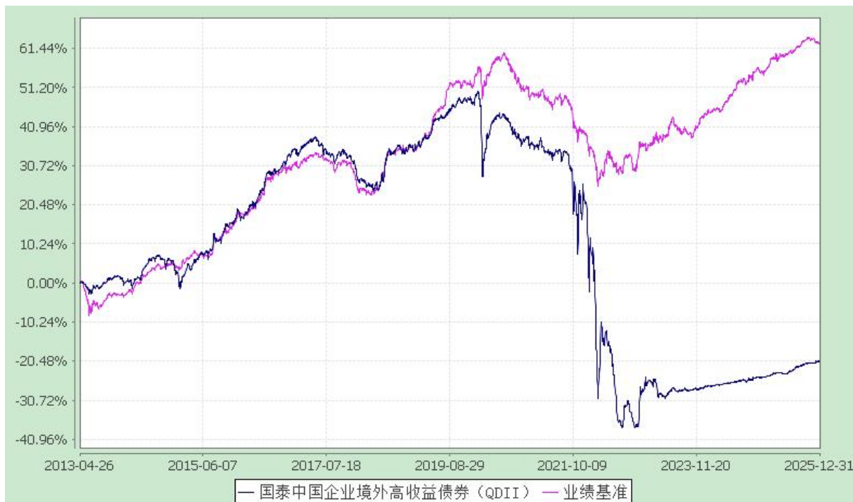
国泰中国企业境外高收益债券型证券投资基金 份额累计净值增长率与业绩比较基准收益率历史走势对比图 (2013 年 4 月 26 日至 2025 年 12 月 31 日)

注：（1）本基金的合同生效日为 2013 年 4 月 26 日。本基金在六个月建仓期结束时，各项资产配置比例符合合同约定。