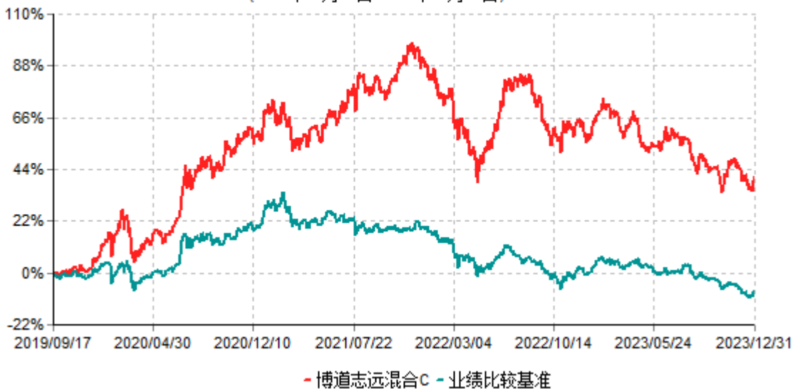
博道志远混合C累计净值增长率与业绩比较基准收益率历史走势对比图 (2019年09月17日-2023年12月31日)

注：本基金建仓期为自基金合同生效日起的6个月。截至建仓期结束，本基金各项资产配置比例符合基金合同及招募说明书有关投资比例的约定。