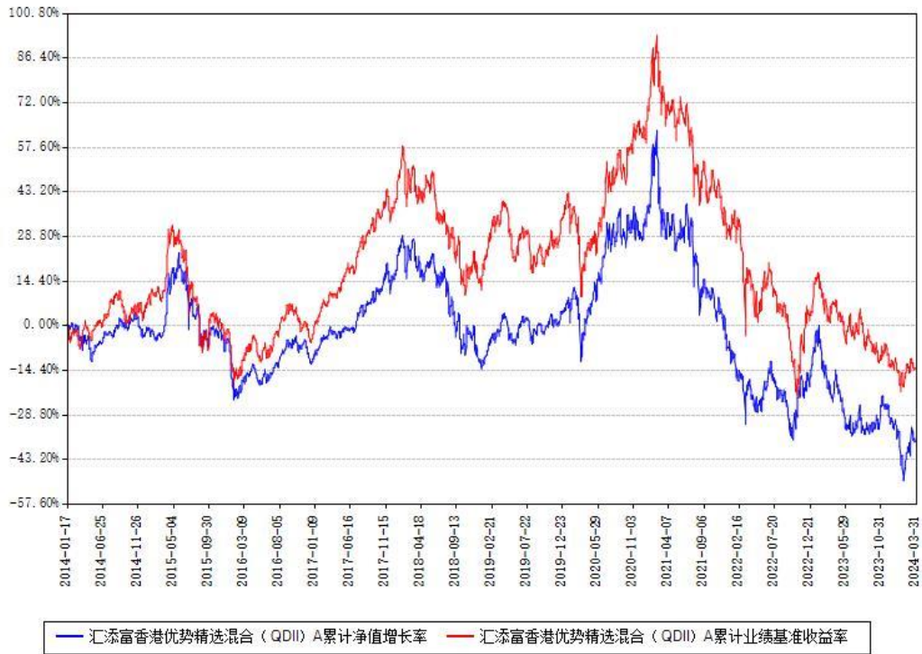
汇添富香港优势精选混合（QDII）A累计净值增长率与同期业绩基准收益率对比图