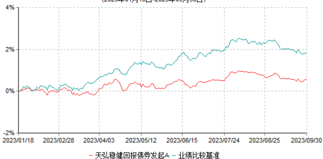
天弘稳健回报债券发起A累计净值增长率与业绩比较基准收益率历史走势对比图 (2023年01月18日-2023年09月30日)