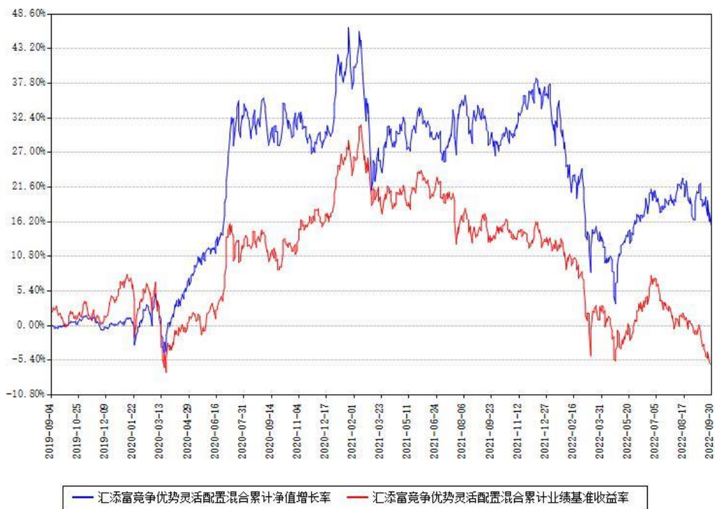
汇添富竞争优势灵活配置混合累计净值增长率与同期业绩基准收益率对比图