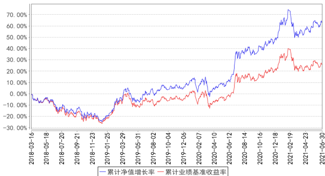
泰达宏利沪深300A累计净值增长率与同期业绩比较基准收益率的历史走势对比图