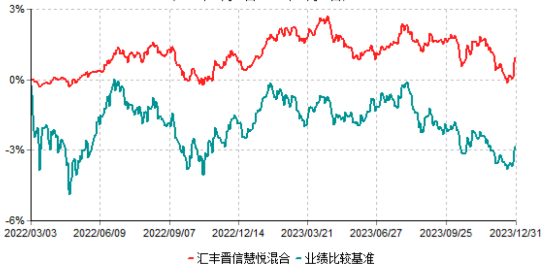
汇丰晋信慧悦混合型证券投资基金累计净值增长率与业绩比较基准收益率历史走势对比图 (2022年03月03日-2023年12月31日)