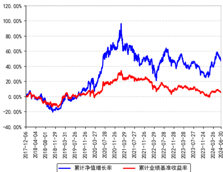
南方优享分红灵活配置混合A累计净值增长率与同期业绩比较基准收益率的历史走势对比图