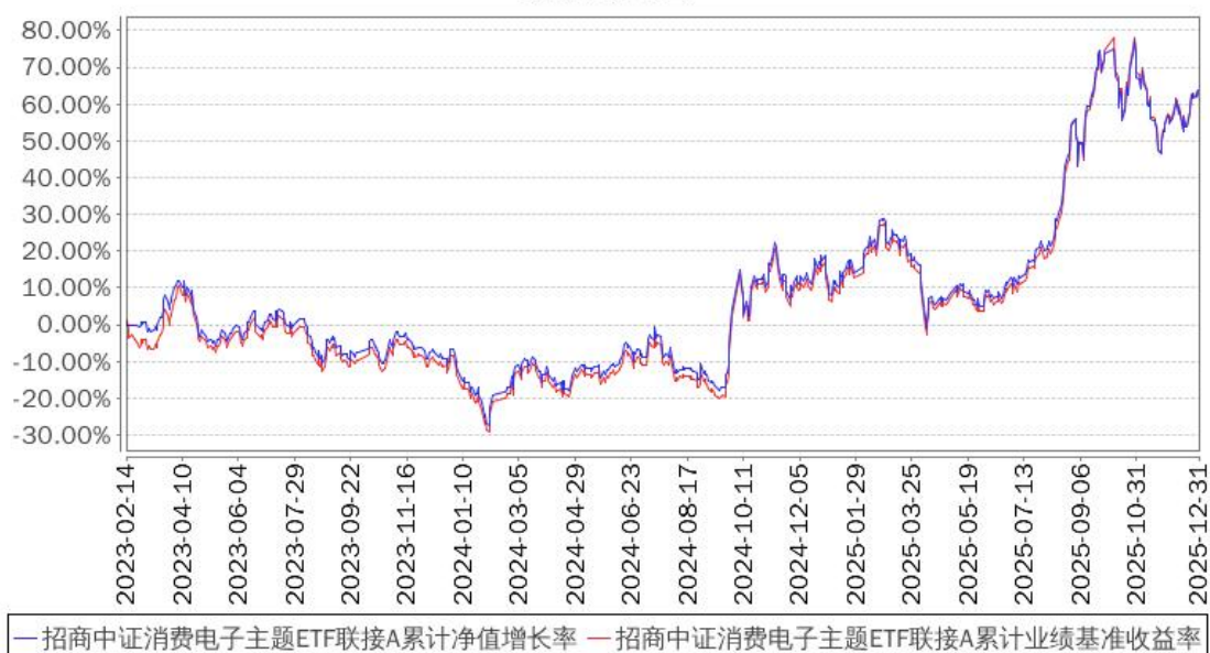
招商中证消费电子主题ETF联接A累计净值增长率与同期业绩比较基准收益率的历史走势对比图