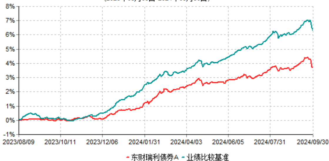
东财瑞利债券A累计净值增长率与业绩比较基准收益率历史走势对比图 (2023年08月09日-2024年09月30日)