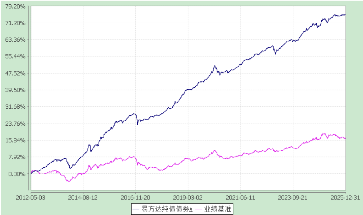
易方达纯债债券 C (2012 年 5 月 3 日至 2025 年 12 月 31 日)