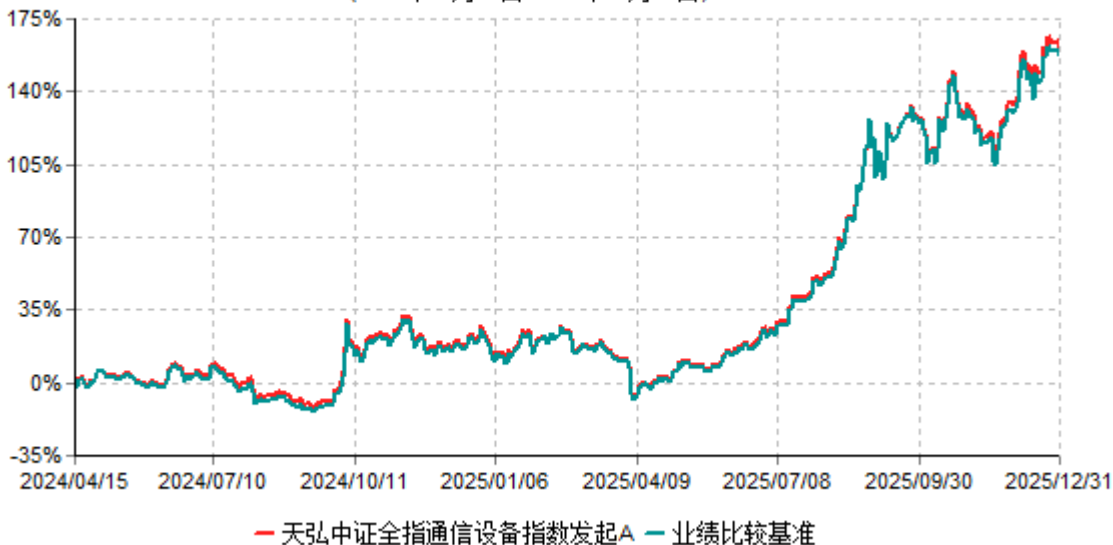
天弘中证全指通信设备指数发起A累计净值增长率与业绩比较基准收益率历史走势对比图 (2024年04月15日-2025年12月31日)